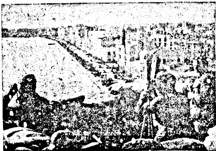
Soldai din primele unități germane ajunse în portul Salonic.