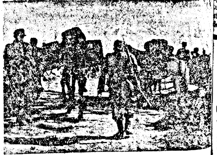
Vânători de munte germani în fața muntelui Olimpia.