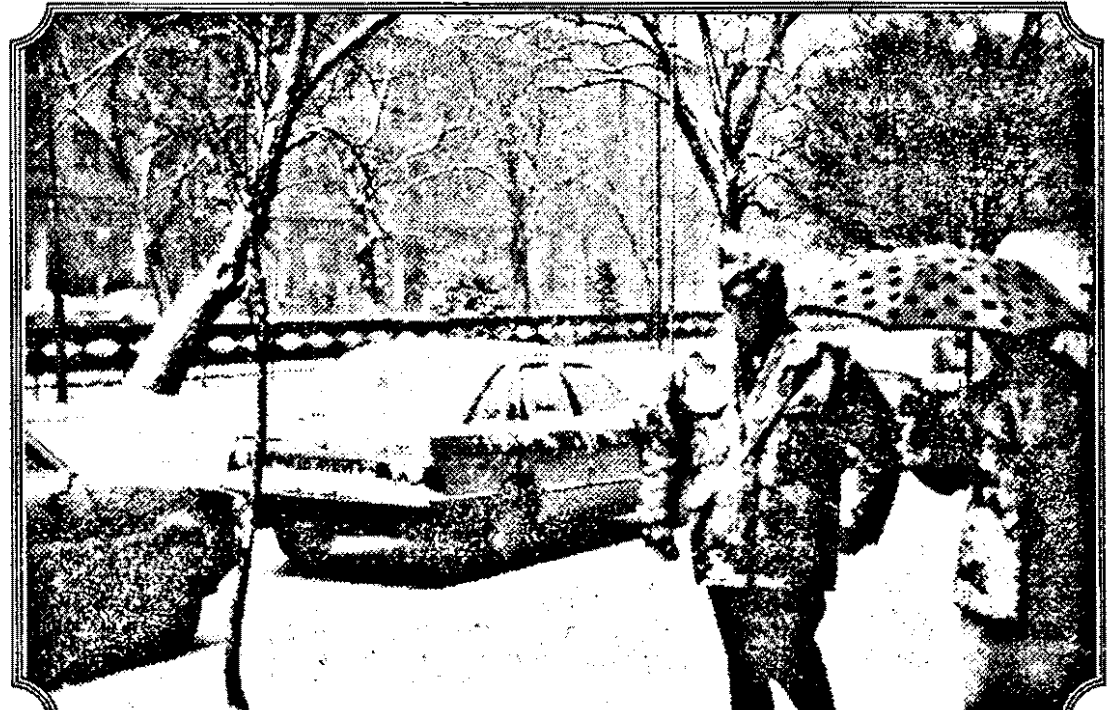
Ieri era iarnă. Astăzi...