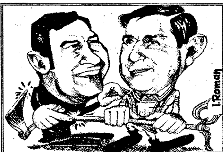
László Tokes: - Măi Ghiță Funar, dacă știi că mă inviți la... „Călușar”, veneam fără bardă și sutană!

Arădenii - încă trei luni fără viceprimar