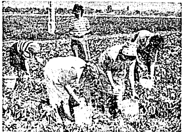
În ferma nr. 9 a Stațiunii de cercetare și producție legumicolă Aradul Nou se lucrează cu spor la recoltarea ardeiului gras.

În paralel cu toate aceste lucrări s-au făcut pregătirile necesare campaniei agricole de toamnă care, după stadiul de coacere al lanurilor, va debuta peste puține zile, cu recoltarea florii-soarelui.