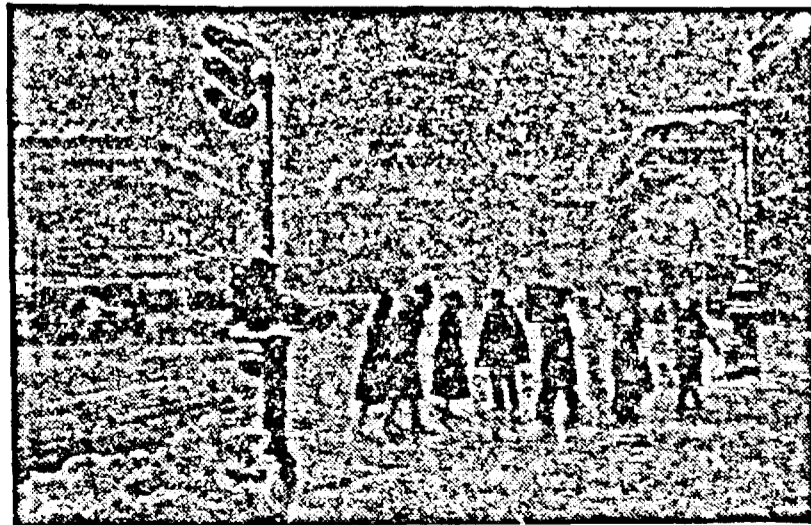
Zăpădi la Paris. — O vedere a Pieței de Popov.