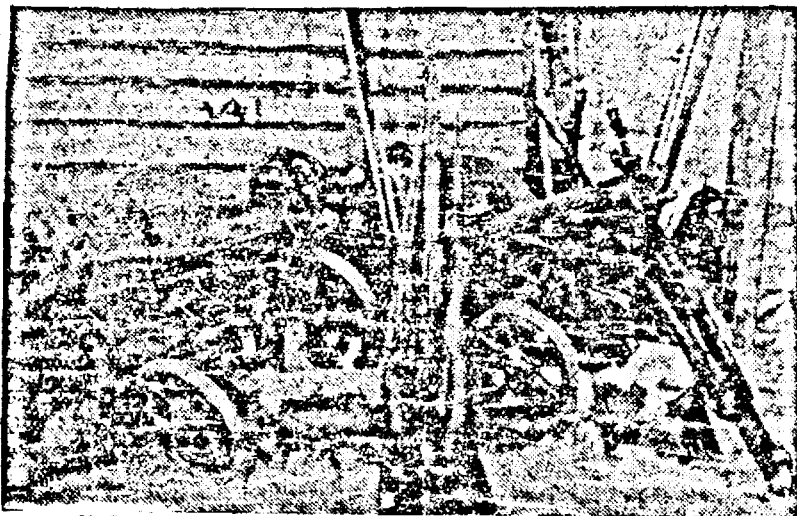
Războiul ruso finlandez. — Armele și munițiunile rusești căzute în mâinile finlandezilor

terial de războiu de tot felul. Cantități necrezute zac în toate șanțurile. Infrângerea sovietică nu miră pe spectator, atunci când acesta privește șoseaua îngustă străjuită de două șanțuri adânci, unde cel mai mic derapaj provoacă fatal oprirea în loc a unei coloane întregi.