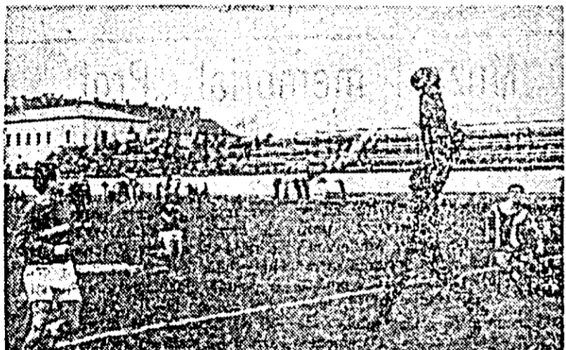
IN CLIȘEU: Aspect de la jocul C.F.R. IRTA — Tractorul Corabia.