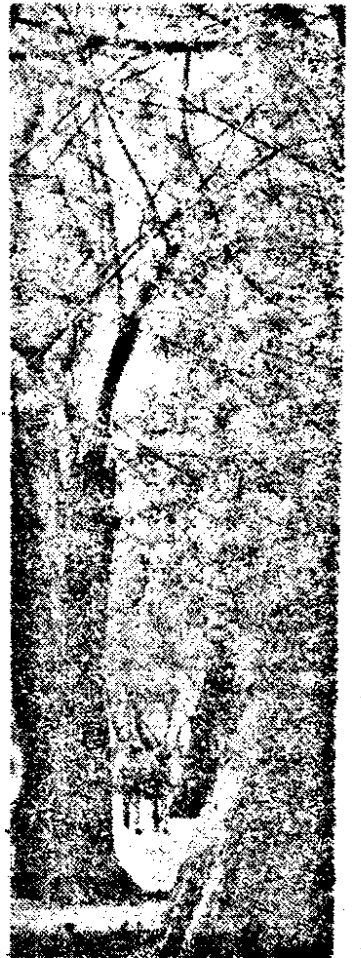
Să sperăm că aceasta primăvară „tîrziu” o de-bun augur și pentru Arad.