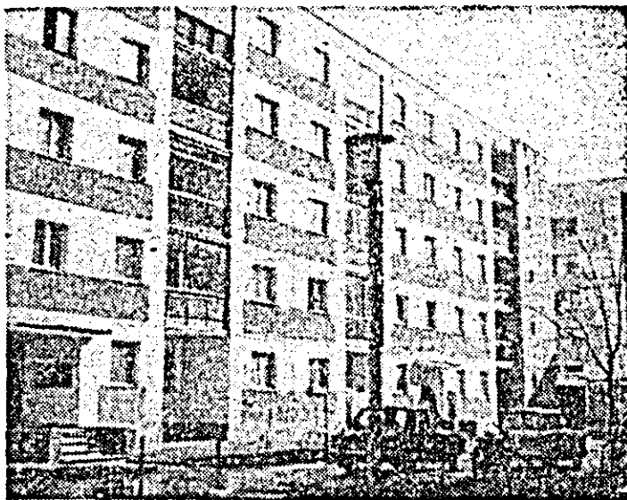
O imagine care vorbește de la sine despre dezvoltarea pe care a cunoscut-o Lipova. Noile blocuri de locuințe au adus un plus de confort și bunăstare locuitorilor, un plus de frumusețe orașului.