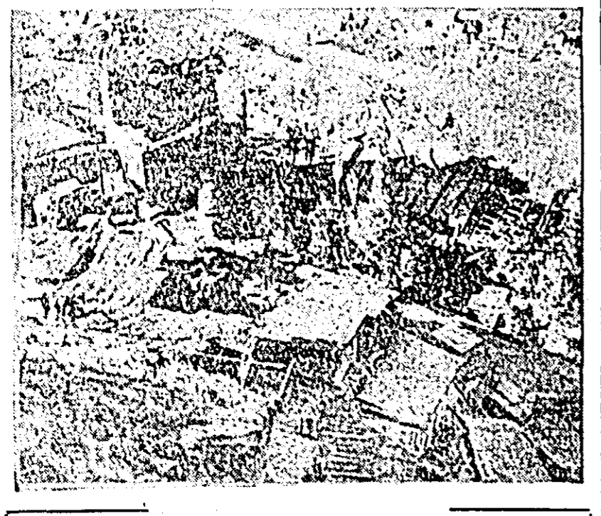
ANKARA. In capitala Turciei există palate al căror lux îi concurează pe cei al palatelor din poveștile celor 1001 de nopți. Există însă și o sumedenie de locuințe pentru a căror mizerie e greu să găsești concurență...

Săptămînalul francez „Tribune Des Nations” respinge afirmațiile guvernului regal al Laosului, reluate de anumite cercuri din Occident, în legătură cu un pretins „amestec”