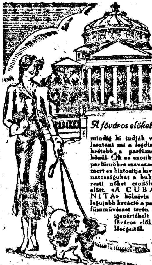
A főváros előkelői

— A Gutenberg-dalkör vezetősége felkéri működő tagjait, hogy csütörtök este a Gutenberg-Othonban tartandó dalórára teljes számban jelenjenek meg.