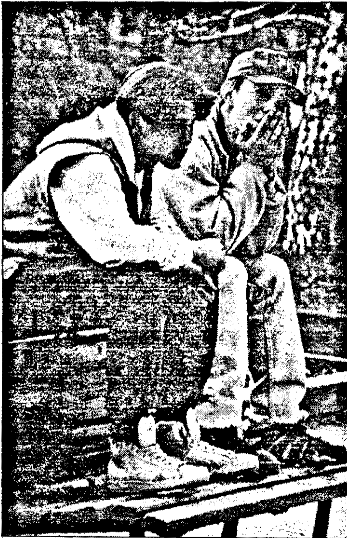
Chiar în prag de sărbători, unii mai poartă adidași.