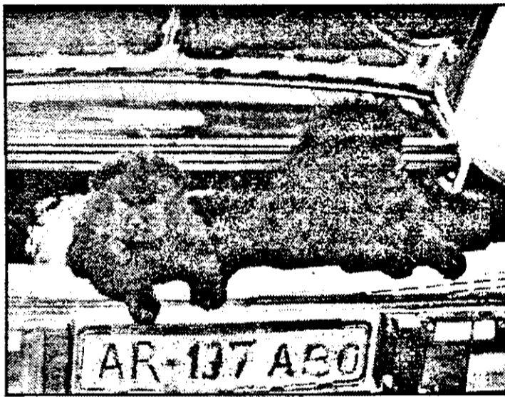
„Înțeleg că stăpânul nu prea vrea să plătească taxe pentru noi. Dar oare nu merităm?”

Peștii (20.02-20.03) Uneori este necesar să faci în viață un lucru pe care, în alte situații, nici nu ai îndrăzni să-l gândești. Dând dovadă de curaj, nu veți fi dezamăgit.