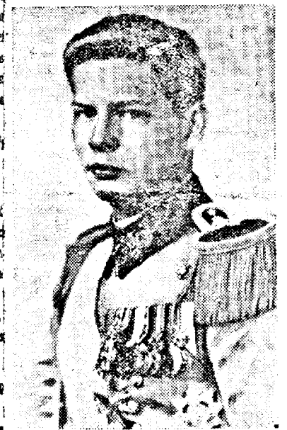
Măria Sa Marele Voevod Mihai de Alba Iulia

Măria Sa — de mic încă — a fost deprins cu aroma faptei bune și cu dulcea mireasmă a sentimentelor.