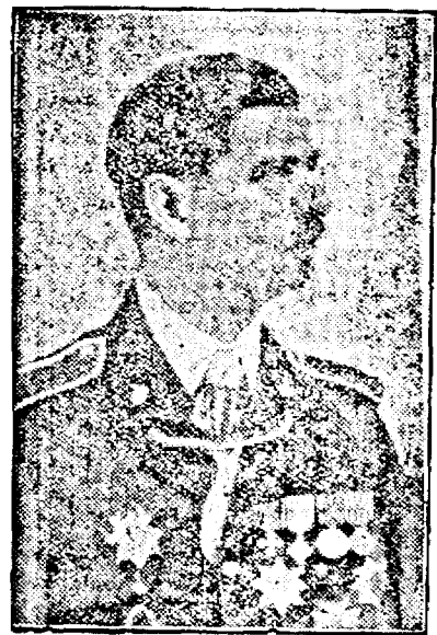
Majestatea Sa Regele Carol al II-lea

Țara acum e liniștită și mulțumită. Domnește pretutindeni desăvârșită încredere, nădejdi mari și simțimente de netedă și unanimă ușu-