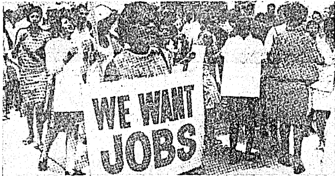
S.U.A. — Aspect din timpul unei recente demonstrații a negrilor din cartierul Harlem din New York, în cadrul căreia demonstrații au cerut guvernului să li se asigure posibilitatea de a munci, știut fiind că numărul șomerilor de culoare este de patru ori mai ridicat decât cel al populației albe.

Tot în acest an, menționează Cartea Albă, vor începe lucrările pentru construirea primului vas atomic japonez, care urmează să fie lansat la apă în 1971 și care va avea o capacitate de 8.000 tone.