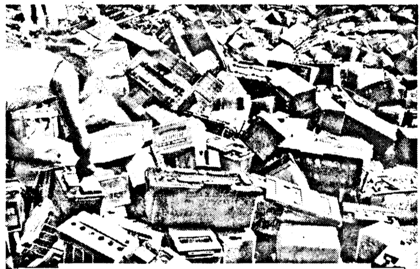
Recuperarea plumbului din acumulatori

Legea nr. 465 din 2001 prevede faptul că deținătorii de deșuri industriale sunt obligați să se ocupe de strângerea, sortarea și depozitarea temporară a acestora în vederea predării la agenții economici specializați, sub rezerva aplicării unei sancțiuni de 50 de milioane de lei.