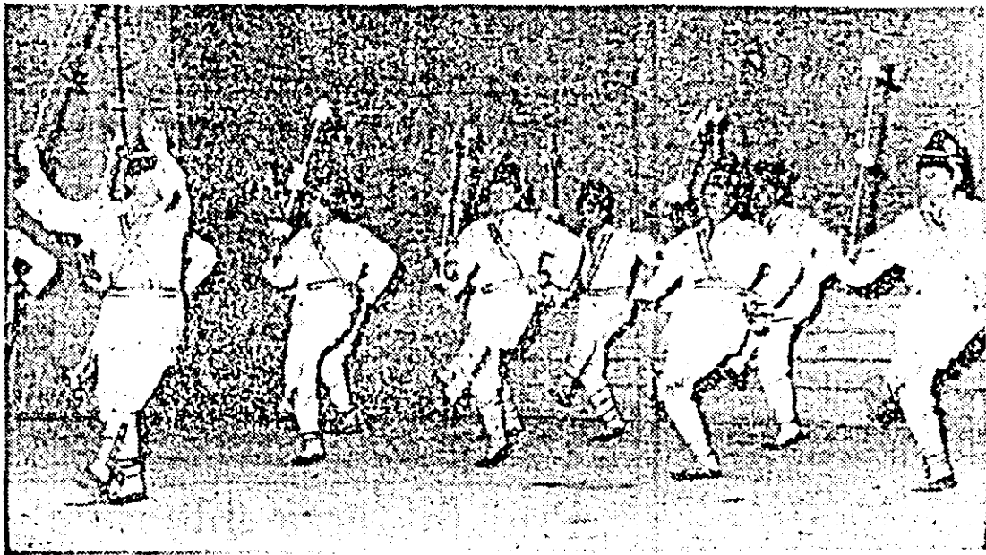
Calușarii din Birsa, o prezență mereu activă pe scena Festivalului național „Cîntarea României”.