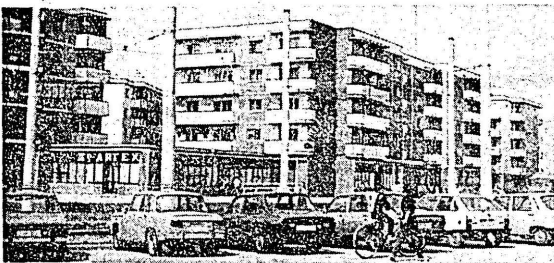
Noi blocuri de locuințe în zona gării Aradul Nou.