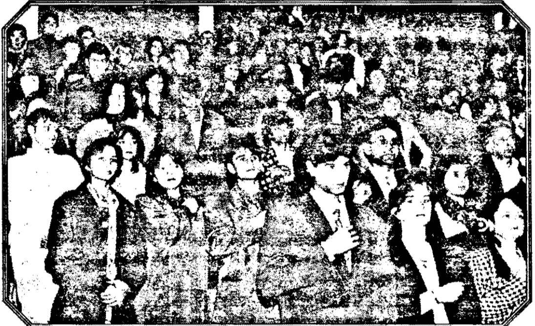
„Gaudeamus igitur”...