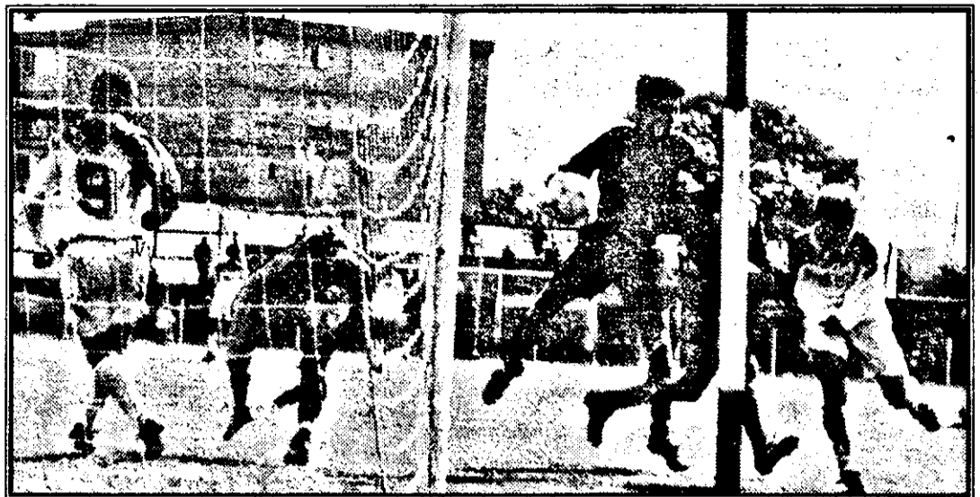
Dan Mănișă (în alb, în dreapta imaginii) înscrie cu capul unicul gol al partidei: UTA-FORESTA 1-0.