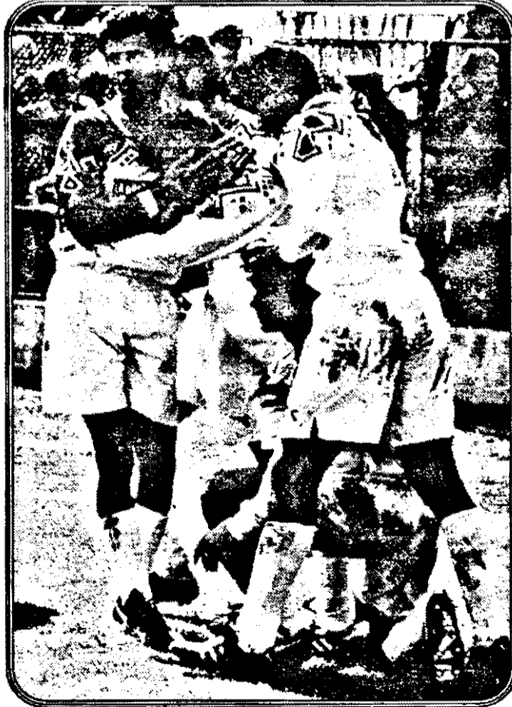
Bucuria golului, sau UTA-Foresta Fălticeni - 1-0