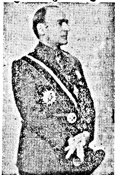
D. Armand Călinescu

Antiversarea de zilele trecute, un an dela proclamarea Constituției, prin masivitatea participării poporului, a arătat că epoca de renaștere națională începută acum un an, este o realitate indiscutabilă. Mai cu seamă că în cele 12 luni trecute se încheie cu un bilanț de realizări neîntâlnite în toți ceilalți ani dela Untre încoace. Este un început numai, bi-