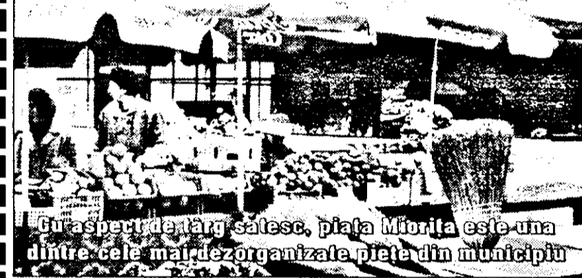
Cu aspect de târg sătesc, piața Miorița este una dintre cele mai dezorganizate piețe din municipiu