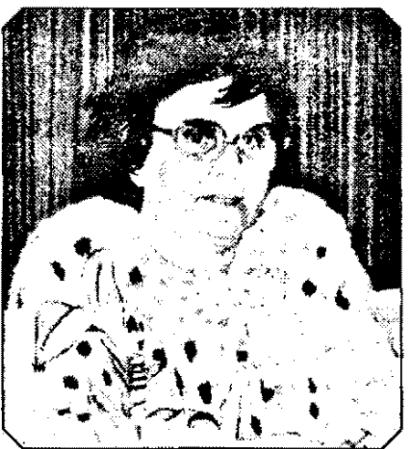
care vor fi luate.

- Dacă acum rata șomajului este de 6%, urmează să trecem prin 12-13%, pentru ca la sfârșitul anului să fim la o medie de 9%. Va trebui să facem față unui număr important de șomeri, într-un timp relativ scurt. Este vorba de aproximativ 200.000 de persoane, nu un milion, cum s-a spus, dar nici 80.000, cum am sperat noi la început. Mișcările sociale ne îngrijorează și ne fac să credem că nu am fost destul de expliciti în privința măsurilor de protecție socială