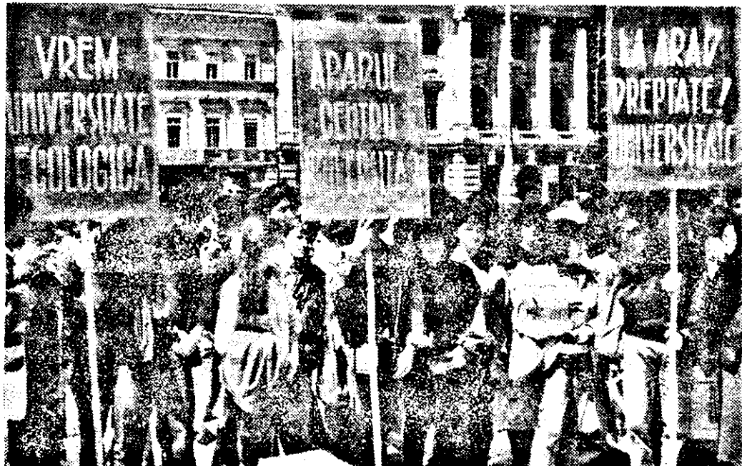
Aspect din timpul mitingului elevilor.