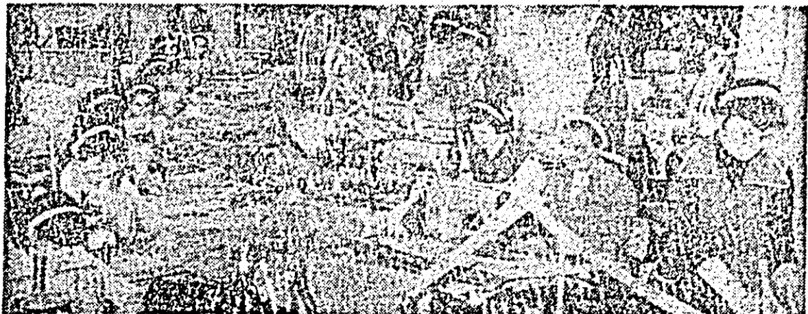
Întrecerea tinerelor confecționere a adus o contribuție de seamă la însemnatele succese cu care întreprinderea de confecții împlinînd Congresul al XII-lea al P.C.R.