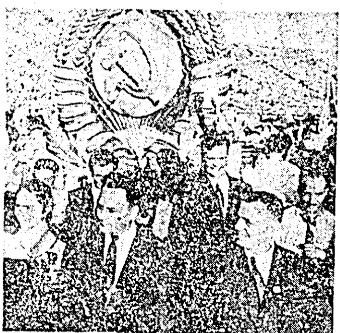
— 1. — Abia sosiți la Varșovia tinerii au și înghebat prietenii trainice. 2. — Tineretele poloneze defilînd pe stadionul „A X-a aniversare” din Varșovia la deschiderea Festivalului. 3. — O parte a delegației sovietice prezentă la Festival în timpul defilării.