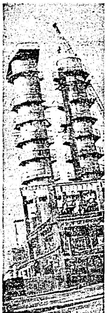
Pe platforma industrială de nord-vest a municipiului prinde contururi tot mai precise noua fabrică de zahăr.