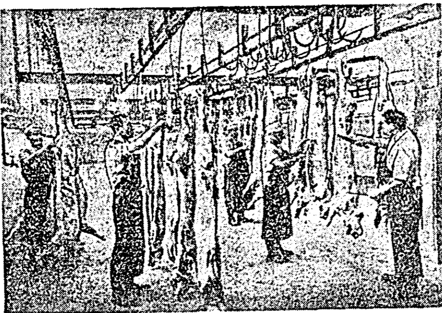
Aspect din noua hîală de zvintat carne, înzestrată cu instalații moderne și care a fost dată în exploatare de curînd.

Pe lîngă acestea s-au aplicat mai multe măsuri tehnico-organizatorice și mici mecanizări ca: mecanizarea sălii de sacrificare a porcinelor cu elevator și depilator, 20 cărucioare la fabrica de mezeluri, montarea unui malaxor nou și altele. Toate acestea au făcut ca în cele trei trimestre ale anului curent să se prelucereze cu 370 tone mai multă carne și cu 80 tone mai multe preparate carne decît în aceeași perioadă a anului trecut. Productivitatea muncii a crescut în aceeași perioadă cu 133 la sută, iar economiile realizate prin reducerea prețului de cost se ridică la 856.000 lei.