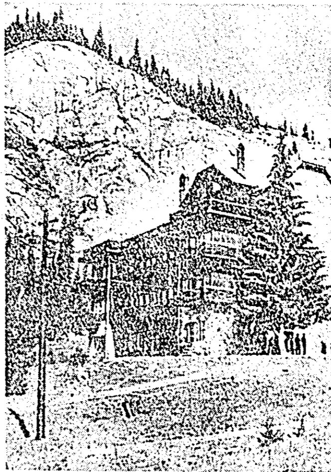
Casă de odihnă din stațiunea Lacul Roșu.

Intr-unul din cartierele mărginașe ale orașului Oradea se conturează tot mai mult profilul noii fabrici de vopsele din pigmenți naturali. Chiar în aceste zile, în interior au început să fie montate primele mașini și agregate, cu ajutorul cărora această nouă unitate a industriei noastre chimice va putea intra în funcțiune parțial în cursul lunii viitoare. Pentru început, fabrica va putea produce zilnic circa 2.000 kg vopsele, iar în cursul anului viitor se prevede ca aceasta să lucreze cu toată capacitatea sa de producție.