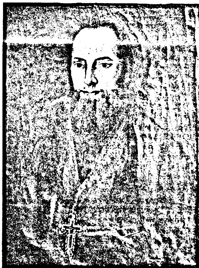
† Episcopul NESTOR IOANOVICI.

Suferințele suferite de neamul nostru i-au