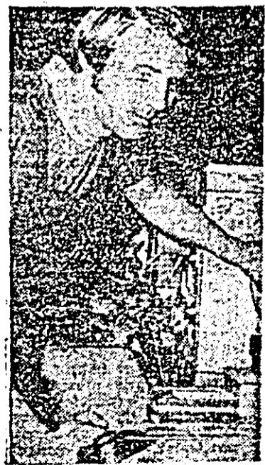
Unul dintre înaltații în întrecere de la L.S.A.: Încășul Gh. Bodonea.