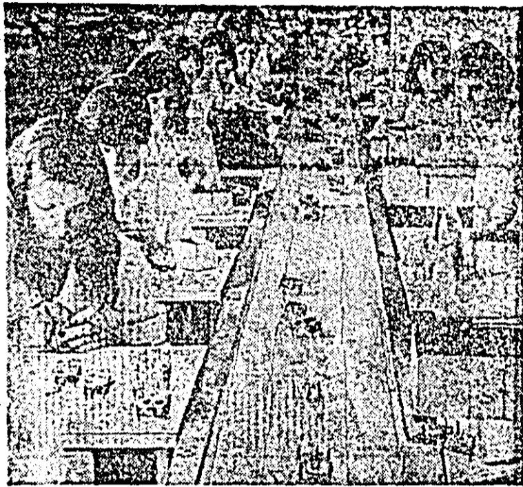
Harnicul colectiv de muncă de la Întreprinderea de cașuri „Victoria” este angajat plenar în realizarea unei producții sporite care să albească atribuțiile unei calități superioare. În ultimul timp au fost create aici o serie de noi produse cu caracteristici tehnico-funcționale superioare. În împlinirea Congresului al XII-lea al partidului, întregul colectiv obține, așa cum s-a angajat, noi și însemnate depășiri de plan. În imagine: secvență de muncă de la banda de montaj.