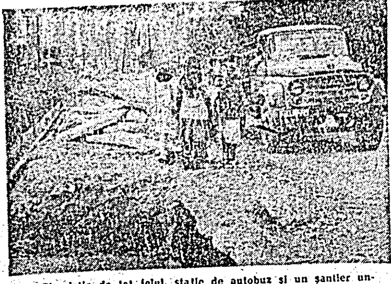
Circulațiile de tot felul, stație de autobuz și un șantier unde se lucrează se vede cum: sîntem pe strada Sverdlov.