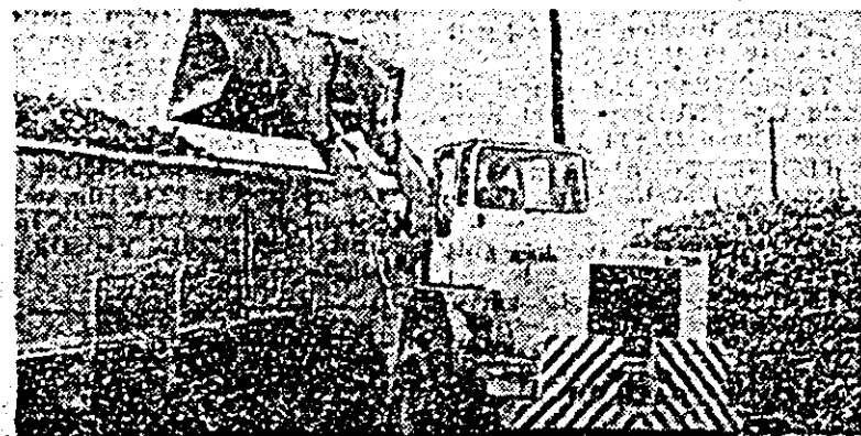
Cu mijloace mecanizate de mare randament, de pe rampa stației C.F.R. Socodor sînt încărcate și expediate la fabrică, ultimele cantități de sîclă de zahăr.

O altă lucrare de sezon — arăturile de toamnă, a fost executată pe 19 000 hectare, suprafețe mai mari față de plan fiind realizate în întreprinderile agricole de stat Chișineu Criș, Nădlac, Șaga. Ultimele și „Scînteia“. Cum pe raza trustului nu s-a realizat decît 56 la sută din plan, trebuie luate măsuri pentru intensificarea arăturilor în toate unitățile și terminarea lor în cel mai scurt timp.