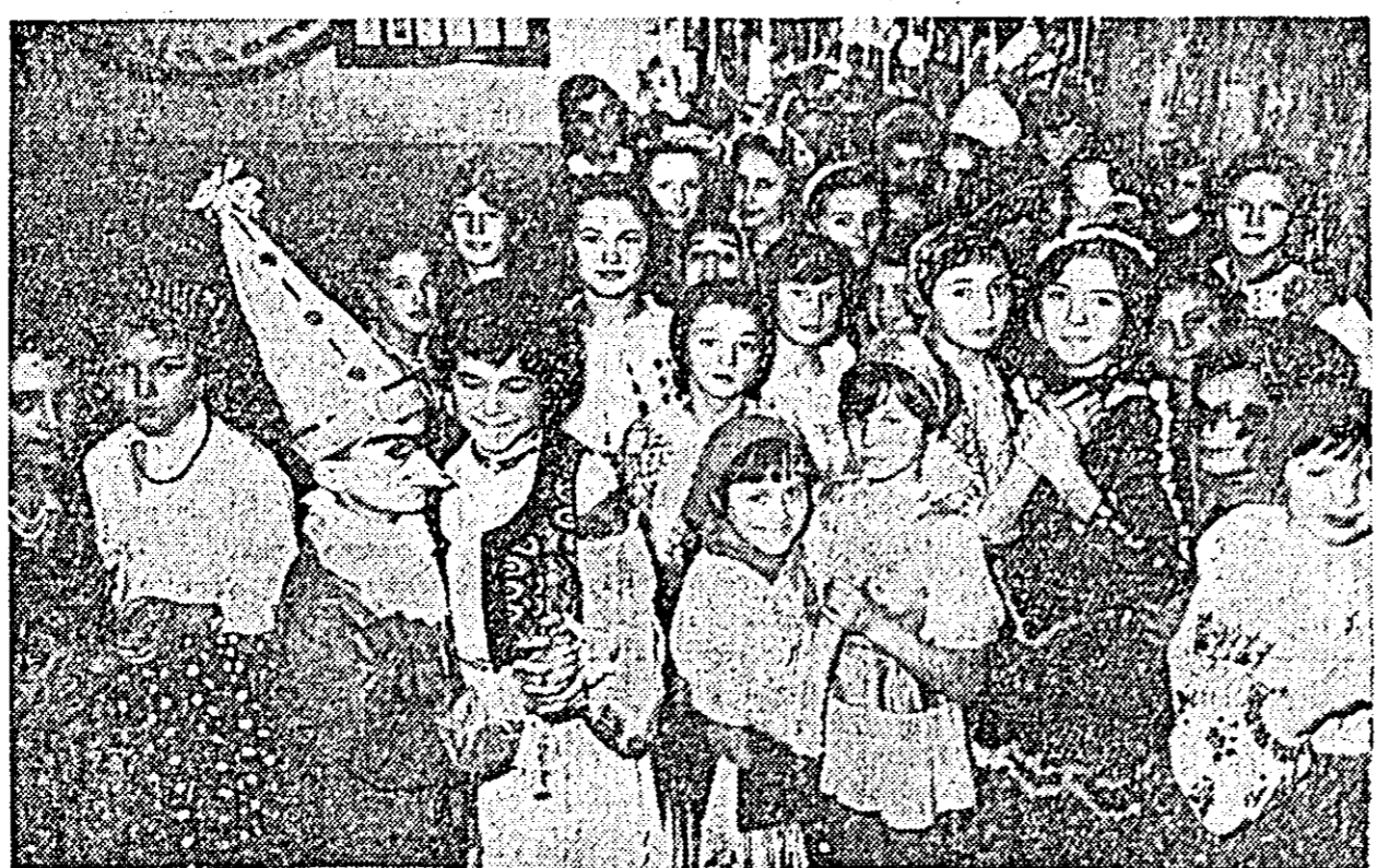
IN CLIȘEU: aspect de la Carnavalul pionierilor. (Cîșii în pagina a III-a reportajul).

O parte din investiții va fi folosită pentru introducerea iluminatului fluorescent. La nevederile, această lucrare e deja gata.