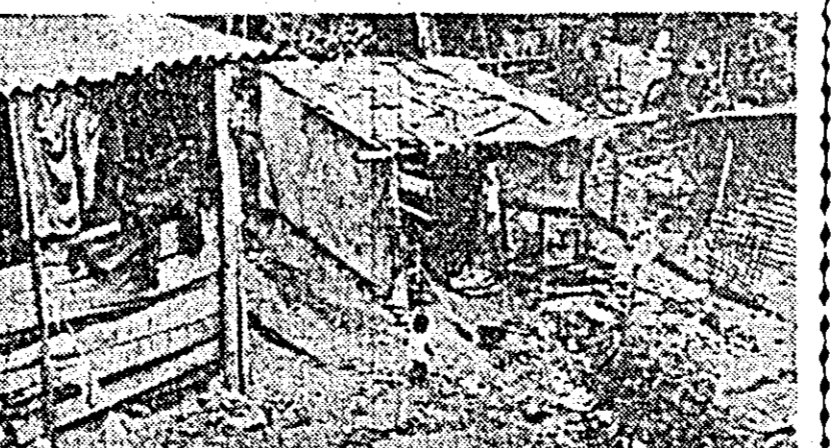
Așa trăiesc mii de oameni în capitala Columbiel