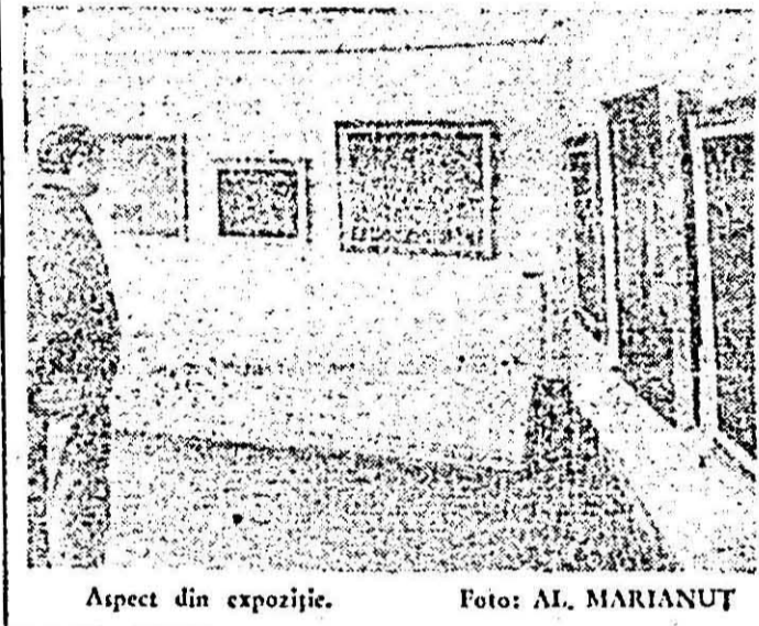
Aspect din expoziție.