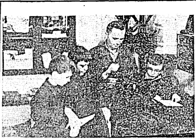
Casa pionierilor Arad. Activități la cerul de tipografie.