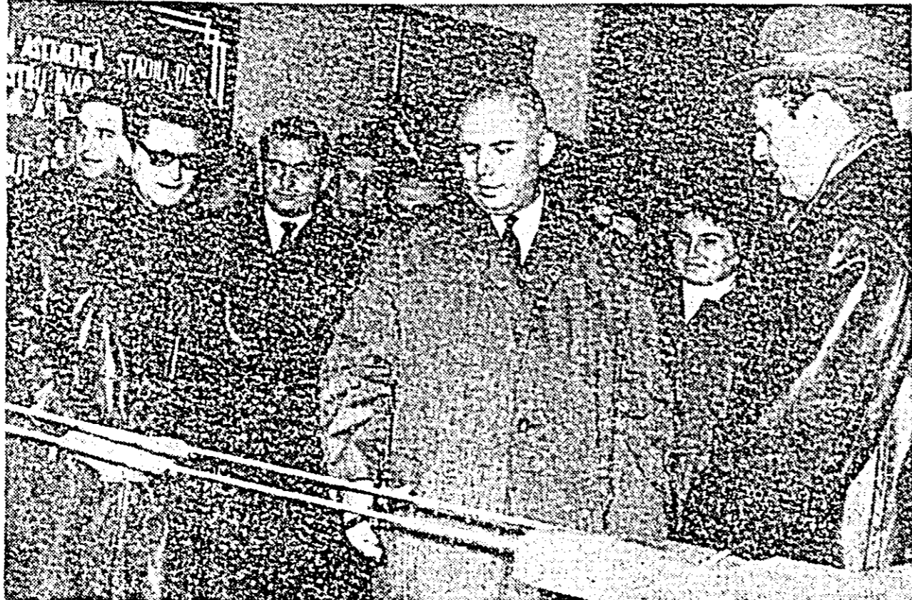
ÎN CLIȘEU: Se taie panglica de deschidere a expoziției.

O hirtie superioară, pentru ambalaje, foarte ușoară, a fost introdusă în fabricația la Combinatul de celuloză și hirtie din Suceava. Hirtia, satinată, este produsă într-o gamă variată de culori. Cu această hirtie se vor fabrica noi sortimente de pungi de măriri diferite, atât pentru ambalarea produselor alimentare cît și a celor textile. De asemenea, se va introduce în fabricația hirtie de ambalaj cu microreponaj de tip „cupack”, cu caracteristici fizico-mecanice superioare, din care se vor confecționa saci cu o rezistență sporită pentru ciment și chimicale.