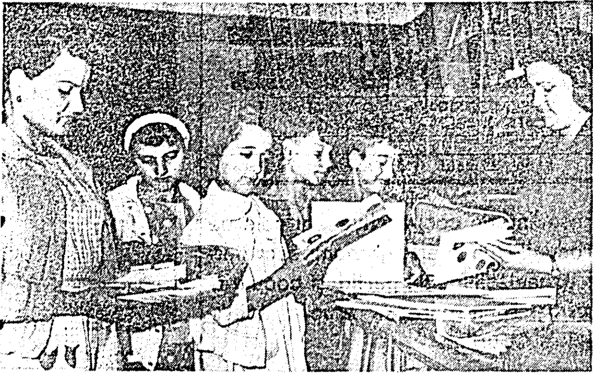
Pentru anul școlar este necesar să te pregătești din vreme. Este ceea ce fac și micii cumpărători din clasașă, pe care obiectivul fotografic l-a surprins la Librăria noastră nr. 1, în plină activitate de aprovizionare cu rechizițele școlare necesare.

scriitor. În Capitală va avea loc o adunare festivă, urmată de un spectacol literar-muzical cu tema „Vasile Alecsandri”. Pe agenda manifestărilor consacrate lui Vasile Alecsandri sînt înscrise, de asemenea festivități culturale-artistice la Iași și Cluj; un recital „Vasile Alecsandri” la Teatrul Național „I. L. Caragiale” din București și o săptămână „Vasile Alecsandri” la Teatrul Național „I. L. Caragiale” din Iași, precum și alte teatre din țară. În centrele regionale și în alte orașe din țară se vor organiza conferințe adecvate, iar la cluburi, case de cultură și câmine culturale, seri literare. Se prevede publicarea seriei de opere complete ale scriitorului, într-o ediție critică, primul volum apărut cu prilejul acestei comemorări; apariția edițiilor „Poeziile populare ale românilor” și „Teatru” — de Vasile Alecsandri, precum și editarea monografiei „Viața lui Vasile Alecsandri”. Aspecte din viața și opera scriitorului vor fi redactate, de asemenea, în expozițiile ce se vor deschide la București, Iași și Cluj. Cu același prilej la Casa memorială „Vasile Alecsandri” din Miercești vor avea loc o pelerinaj, precum și vizite ale elevilor și studenților. Ministerul Transporturilor și Telecomunicațiilor va emite un timbru comemorativ. (Agerpres)