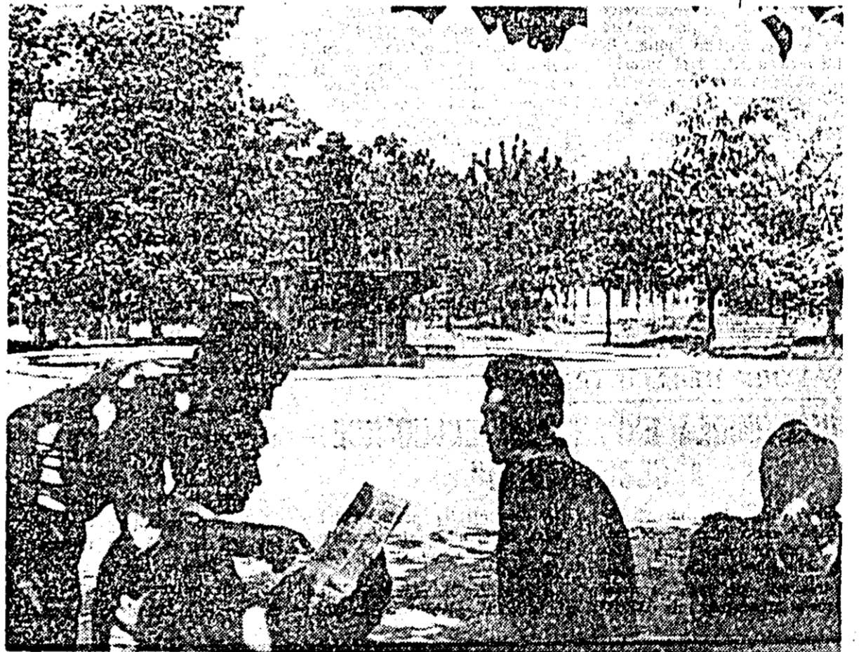
În parcul Vasile Roață.