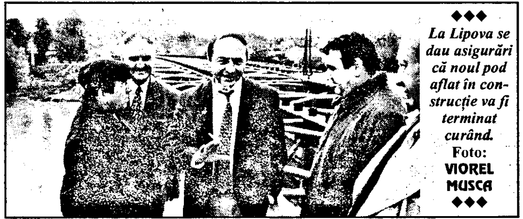
La Lipova se dau asigurări că noul pod aflat în construcție va fi terminat curând.

(Urmare din pagina 1) La festivitate, alături de ministrul T. Băsescu au mai participat prefectul județului, Ioan Horhat, președintele consiliului.