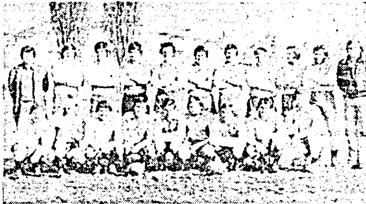
Echipa de rugbi Gloria P.T.T. Arad, proaspăt promovată în divizia A.