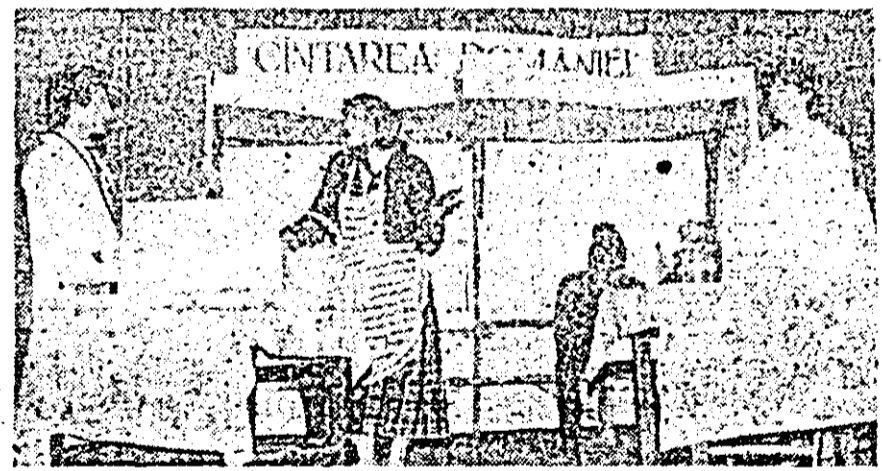
Moment din scena „Navetiștii“ de Ion Băieșu prezentată de artiștii amatori ai Centrului de cultură și creație „Cântarea României“ din Semlac.