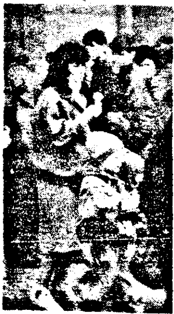
Cum la înghețată...