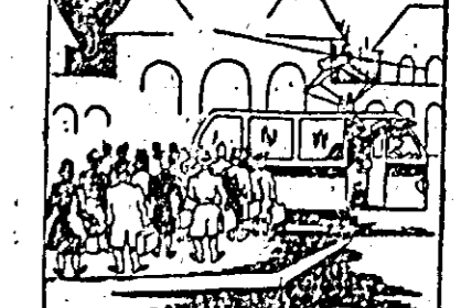
TAXATORUL: „Cîrculăm numai în orele de aglomerație”.

Dimineața, cînd sosesc mulți călători cu trenul, unelt tramvalo se retrag în remiză.