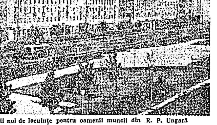
Construcții noi de locuințe pentru oamenii muncii din R. P. Ungară

La Rabat s-a anunțat că urma repetatelor violențe din frontierele Marocului de către trupele franceze care acționează în Algeria, precum și a bombardării teritoriale țărilor vecine militare marocane și în dreapta spre regiunea și orașul Oudjda. Trupelor li s-a dat de din să asigure respectarea drepturilor teritoriale a țării securității populației. (Ag.)