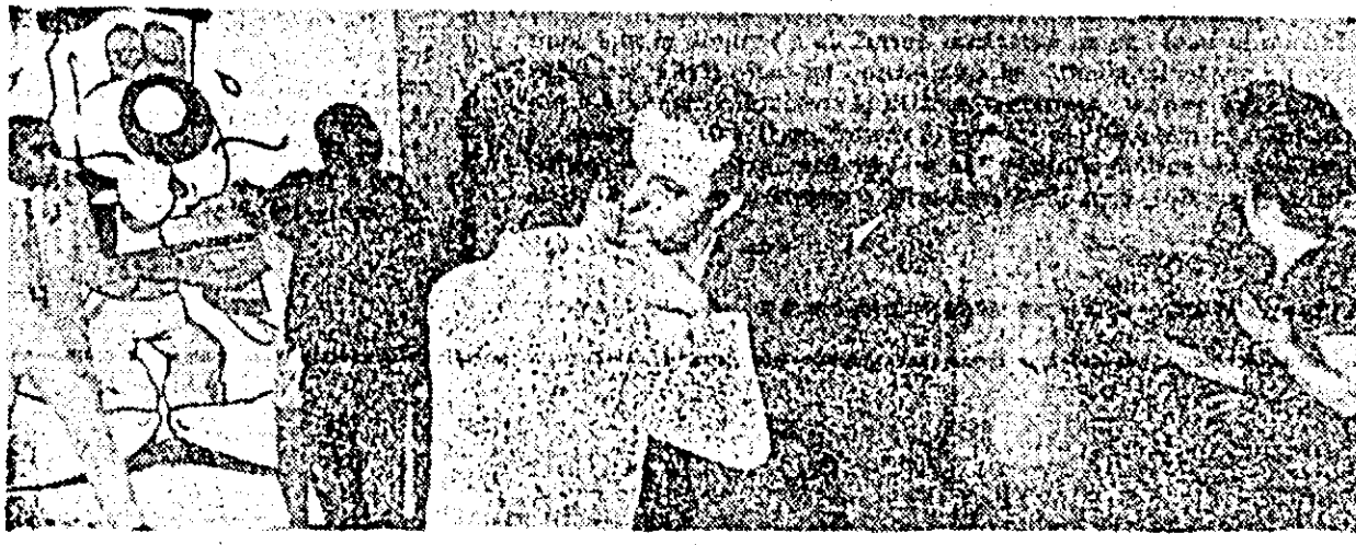
În noaptea revelionului perința a avut mai mult farmec.