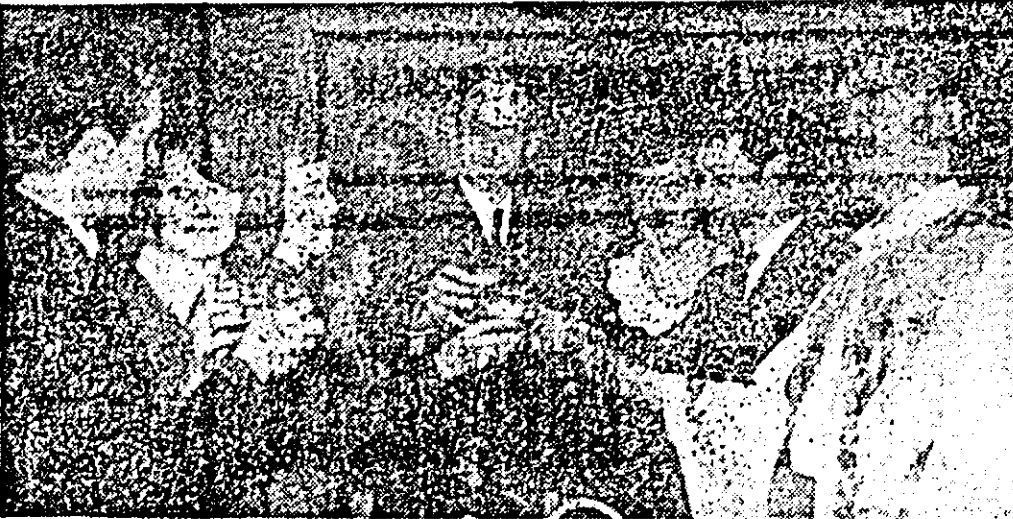
„Și vinul a fost mai parfumat, femeile au fost mai frumoase, bărbații mai chipeși...”