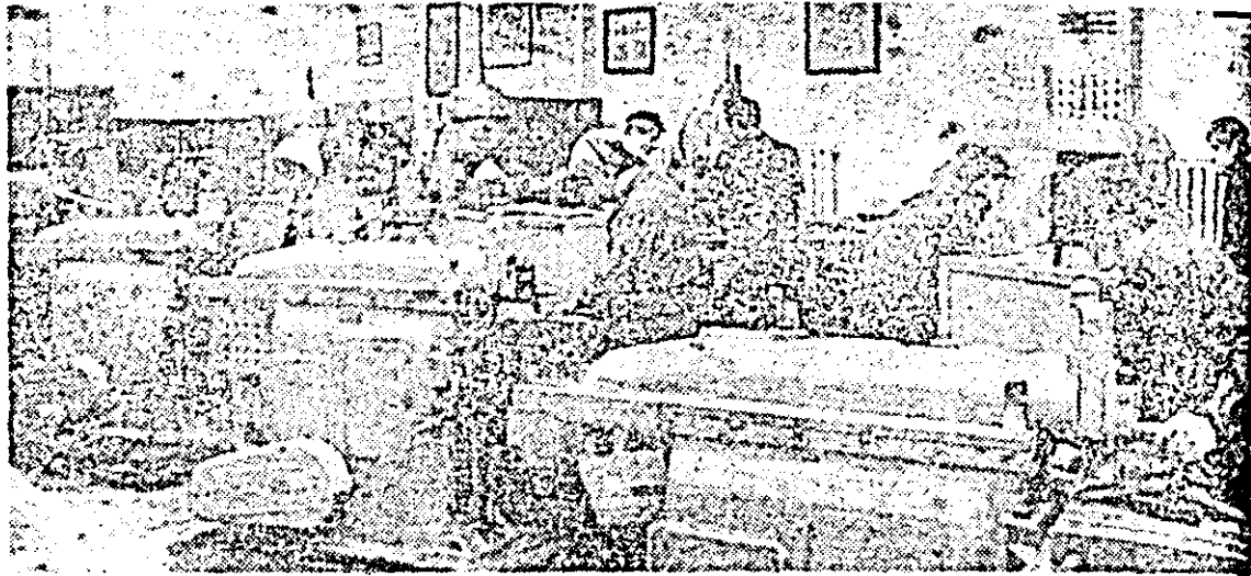
În atelierul mecanic al Liceului Industrial nr. 1 Arad, elevii de azi se formează ca viitoare cadre de nădejde a industriei noastre.

NICOLAE CEAUȘESCU Raport la Congresul al XII-lea al P.C.R.