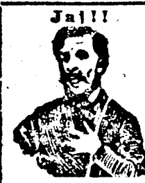
Megfojt az az átkozott köhögés

Közvetítői Szem- és orvosi műszerár Arad, Bul. Regina Maria 2. (Neuman-palota.)