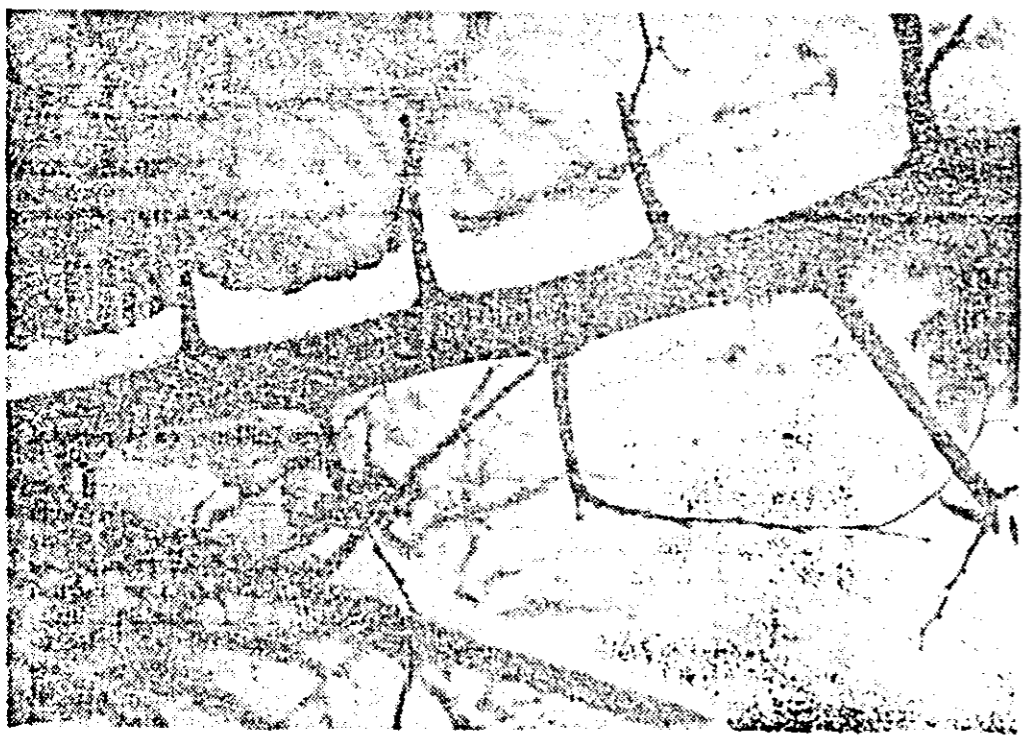
Sopirla zăpezii.