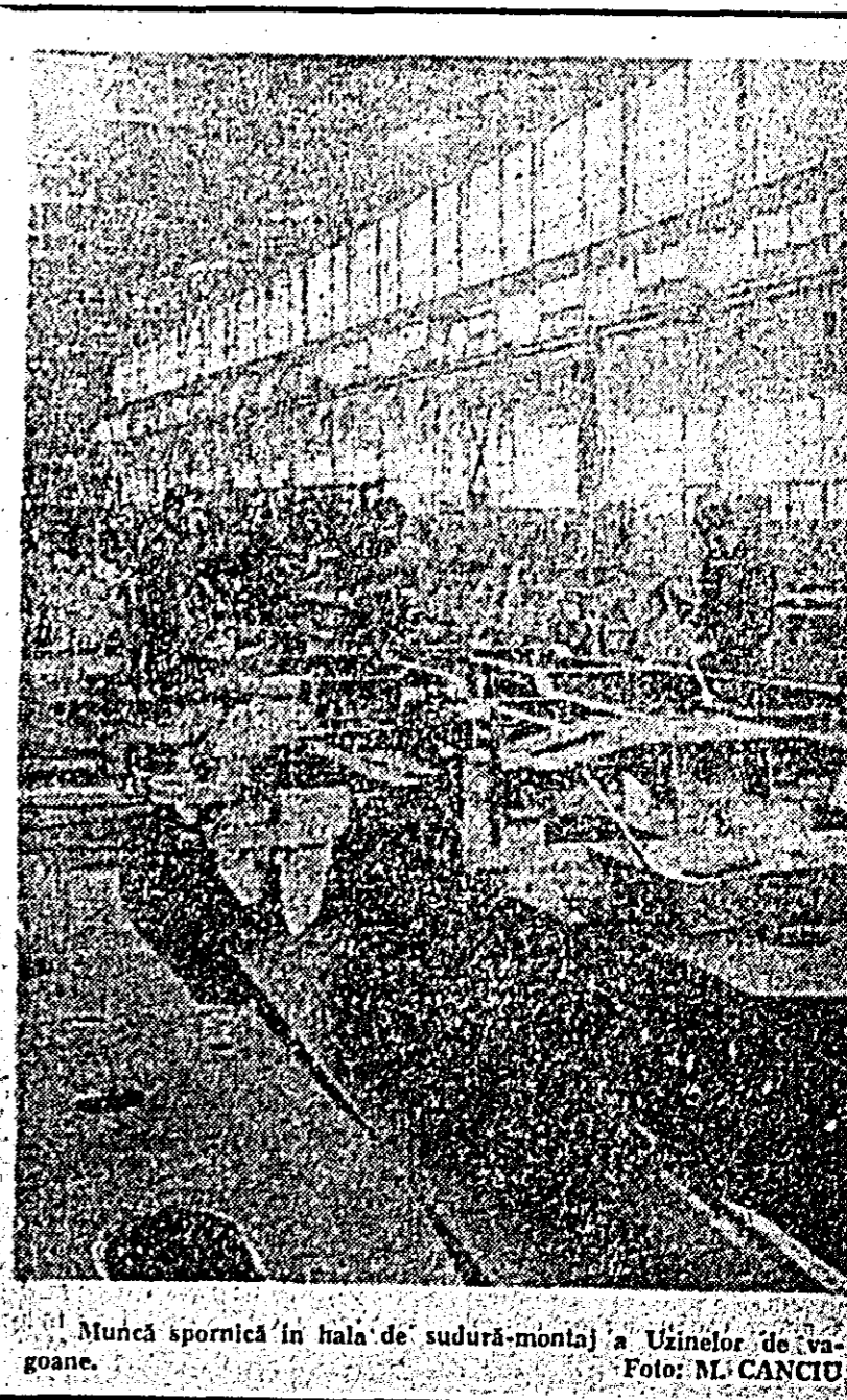
Muncă spornică în hala de sudură-montaj a Uzinelor de vagoane.