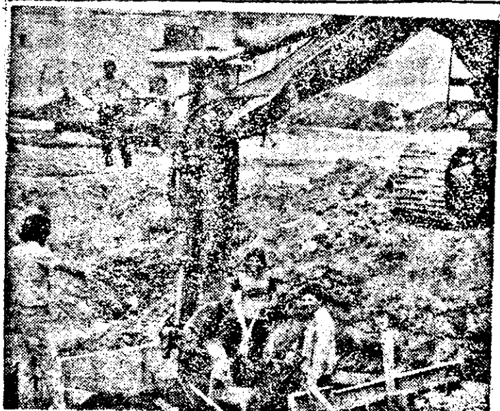
Ritm pe șantier: doi cu sapa, doi... se uită! Cum se vede, a dispărut „mapa“ a rămas „privitul“. Totul se transformă! — vorba savantului.