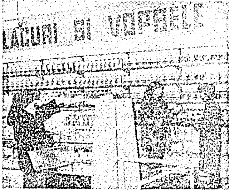
Aspect din Unitatea nr. 8 Chimicată (Plaja Avian. Iancu) recent redeschisă după renovare.

de modernizare a grajdurilor, în cel de vite încă nu a fost introdusă apa, adăparea făcîndu-se cu găleata. Iată deci tot altă motivă care ar trebui să concentreze atenția conducerei unității în vederea desfășurării. În cele mai bune condiții la învățămîntului agrozootehnic, a creșterii eficienței sale în activitatea de îmbunătățire a muncii.