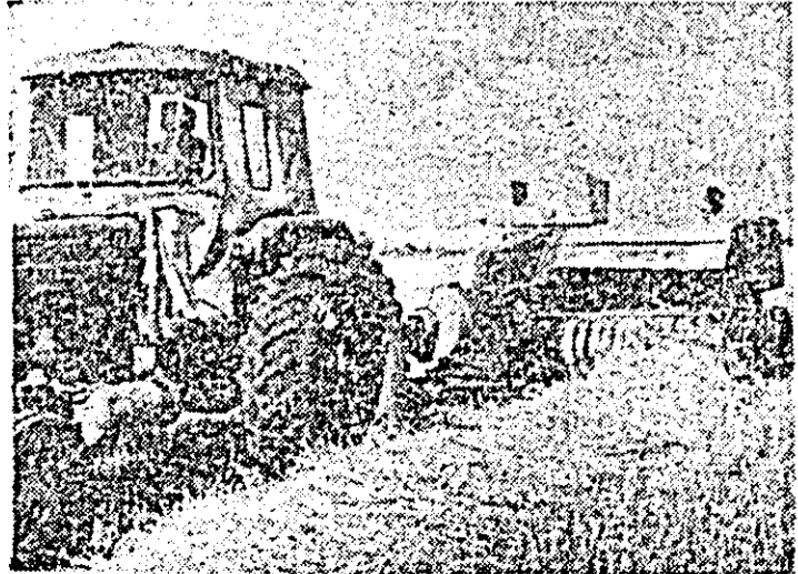
La ferma 1 a I.A.S. Utvinș se lucrează de zor la balotatul paielor.