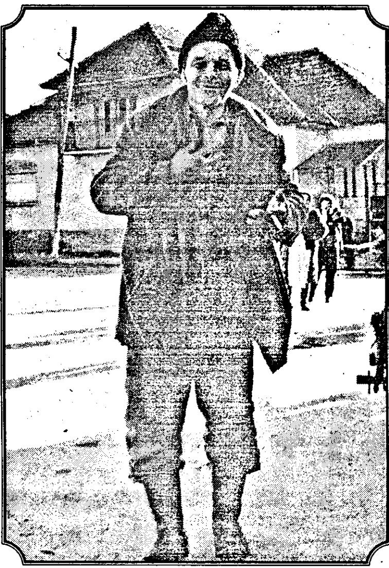
Dacă o fi ceva, contați pe mine!