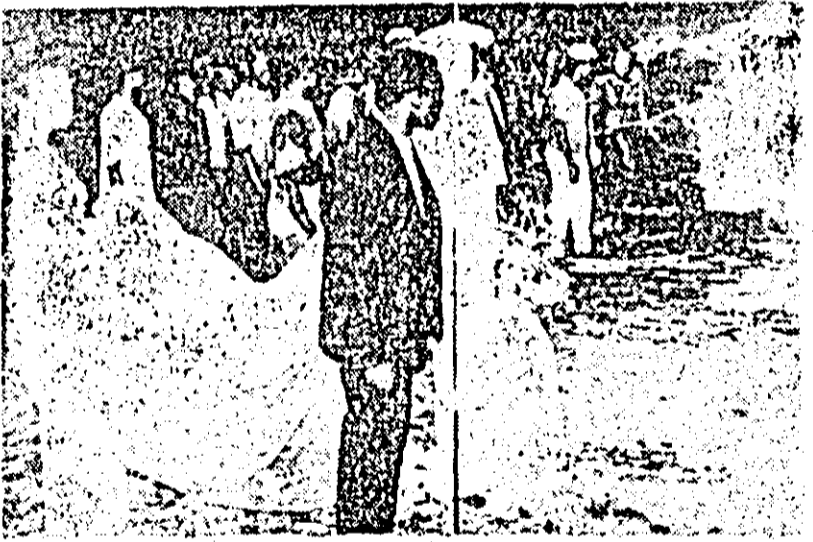
BIAFRA. Dorința de a trăi, desigur cel mai puternic instinct, într-o recentă reprezentare biază: sfînd ploaia de bombe care de mai bine de un an și jumătate a intrat în peisajul cotidian al populației libe, o imaculată ceremonie matrimonială parcurge drumul sacru al împlinirii cununiei, ca și cum războiul n-ar exista, ca și cum moartea ar fi trist apăsător de legendă — un strigăt al vieții în împărăția dăruită de oameni, morții.

Japonia — țară care a cunoscut pentru prima dată în istorie coșmarul cuiperelor atomice — are înscris în Constituția sa un articol prin care se subliniază că nu va avea un potențial militar nuclear, pe baza căruia au fost formulate apărările „neprincipii nenucleare”, „să nu se producă, să nu se poseze și să nu se introducă din afară arme atomice”. Dar declarațiile făcute de premierul Sato, ca și de alte oficialități japoneze, au alarmat populația țării care se teme că guvernul privește aceste principii ca pe o politică de a putea fi „interpretată” sau chiar modificată în funcție de conjunctura politică. Or, în acest mod, pe baza unei interpretări mai subtile a Constituției, s-ar putea ajunge la concluzia că „găzduiască” arme nucleare în diferite cazuri, de pildă în scopuri „defensive”. Un fel de capcană, se apreciază la Tokio, care, în ultima instanță ar putea pune Japonia în fața unor pericole incalculabile. Poziția ambiguă a guvernului japonez a stîrnit mulțumiri și neliniște în cercurile cele mai largi ale poporului japonez.