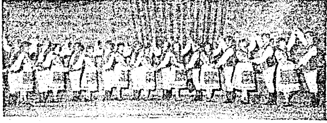
Ansamblul de dansuri populare al Casei municipale de cultură Arad.