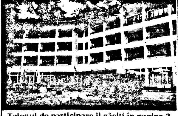
Talonul de participare îl găsiți în pagina 3.

Incepând din această săptămână, în fiecare zi de sâmbătă veți găsi în ziarul nostru un TALON . Completați-l și expediți-l pe adresa redacției și săptămânal veți putea câștiga, prin tragere la sorți, un WEEKEND pentru 2 persoane (pensune completă) la Hotel Parc din Moneasa.