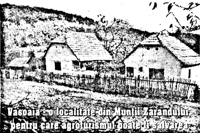
Vasopia - o localitate din Munții Zarandului pentru care agricultura micii s-a băgat.

O primă lansare a acestui proiect a avut loc în cursul anului trecut. La BCR au fost depuse 61 de dosare de acreditare care însă s-au blocat în diferite faze. Un singur proiect a îndeplinit toate criteriile, dar și acela este un proiect de finanțare de 100.000 USD. Ori FIDA se adresează într-o covârșitoare proporție realizării unor investiții mici sau medii de până la 10.000 $. Nici unul dintre acestea nu a ajuns să fie aprobat.