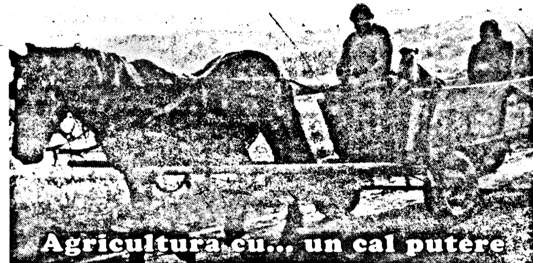
Agricultura cu... un cal putere