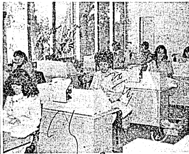
Aspect de muncă la Centrul teritorial de calcul electronic Arad.