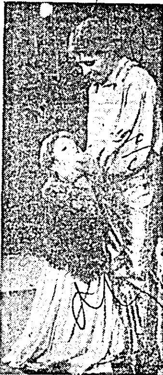
Moment din spectacolul cu piesa „Arca bunei speranțe”.