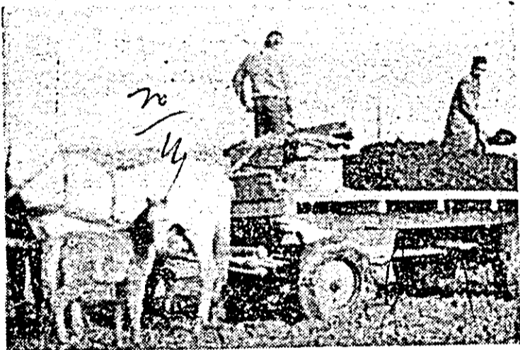
La ferma legumicolă a cooperativei agricole din Olari se acționează intens la fertilizarea terenului.