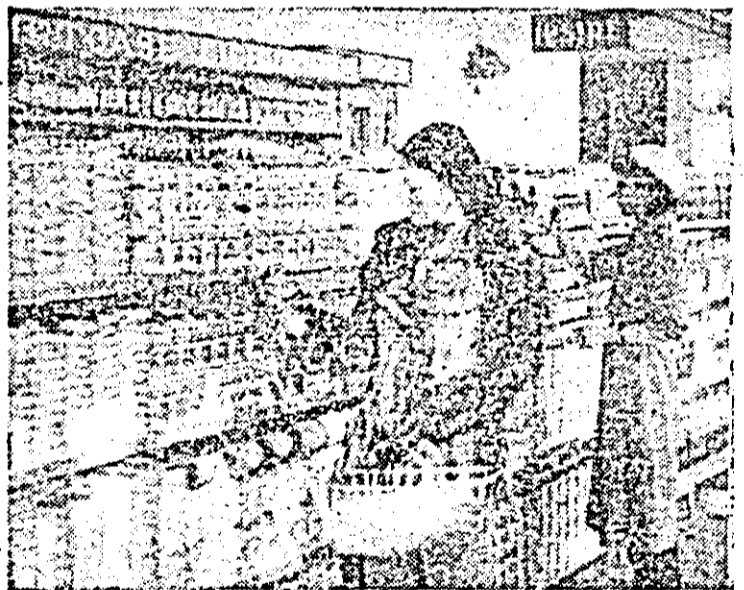
Aspect din magazinul alimentar cu autoservire nr. 32.

terminat, iar cele din Lipova, Ineu se apropie de sfîrșit, comisiile unice din Beliu și Sebiș așteaptă ca semințele să le fie trimise pe calea ferată. Se impune, de asemenea, urgentarea livrării și la sfecla de zahăr și mai ales a trifolienelelor, care fiind trimise la decuscutat la diferite stații în țară nu au revenit decît în parte la centrul de semințe din Arad.