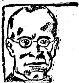
Papa Pius XII

Paris, 20. (Rador). — REUTER: CERURILE AUTORIZATE DESMINT ȘTIREA DUPĂ CARE D. DALADIER AR URMA SĂ SE ÎNTALNEASCĂ MARȚI LA GENOVA CU D. MUSSOLINI SE PRECIZEAZĂ CĂ PRIMUL MINISTRU SE AFLĂ ÎN CURSUL SERII LA PARIS ȘI CĂ EL URMEAZĂ SĂ LA CUVANTUL MARȚI ÎN DEBATERILE CAMERII.