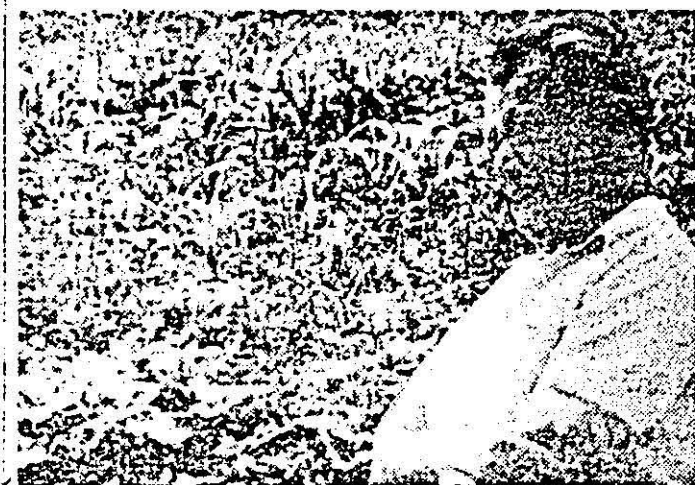
„Și buruienile sînt la fel de nutritive ca și plantele furajere” afirmă șeful fermei.