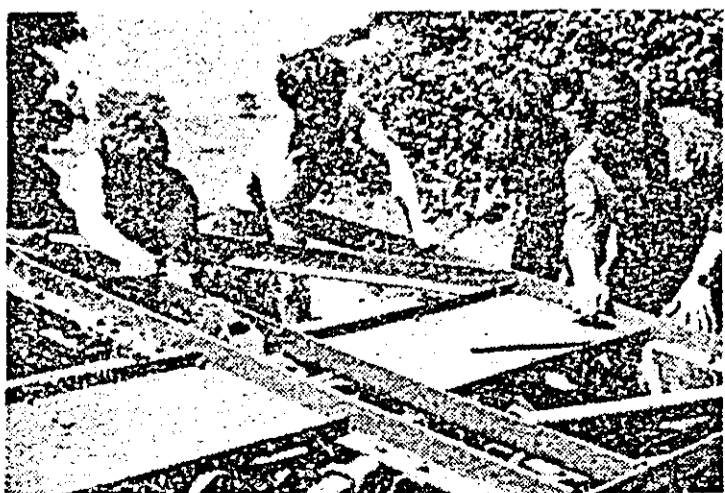
La secția de mecanizare Zimandă Nou se lucrează cu cea...

mestru al anului cu o zi în devans. Aceasta permite obținerea unei producții marfă suplimentare cifră, în expresie fizică, la 3.200 ceașornice echivalente. Totodată, ca urmare a preocupărilor manifestate în direcția diminuării consumurilor specifice, în perioada de timp menționată cheltuielile materiale de producție sînt inferioare cu 299.000 lei nivelului stabilit.